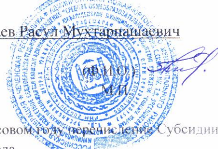
График должен предусматривать первое в текущем финансовом году перечисление Субсидии в срок не позднее окончания одного месяца текущего финансового года.

По решению Учредителя информация может быть приведена в разрезе Субсидии на каждую услугу (работу), оказываемую (выполняемую) учреждением в соответствии с муниципальным заданием.